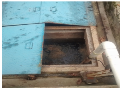
Foto No 3. Cribado