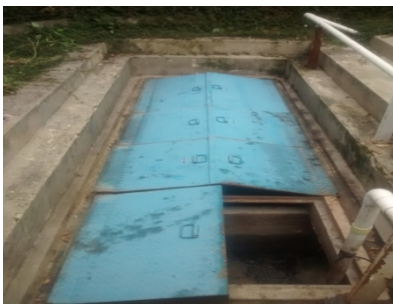
Foto No 1. Vista de sistema de tratamiento preliminar (cribado, trampa de grasas, desarenador)

En las fotos No 10 y 11, se evidencia dos tuberías que realizan descargas de aguas lluvias sobre el canal en tierra ubicada en la calle 223.