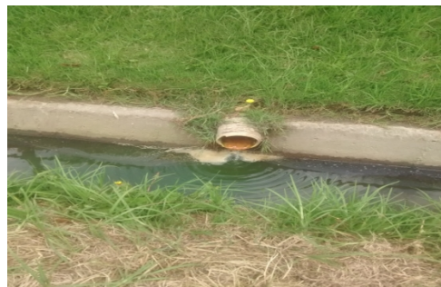
Foto No 12. Descarga de aguas con propiedades organolépticas características de aguas residuales, origen no identificado