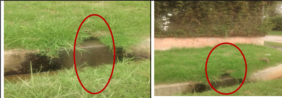
Foto No 8 y 9. Punto de descarga al canal en tierra calle 223