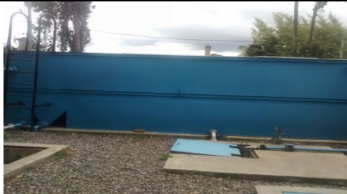
Foto No 6. Tanque de Lodos Activados