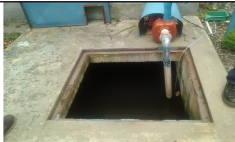
Foto 7. Tanque donde se realiza el proceso de cloración