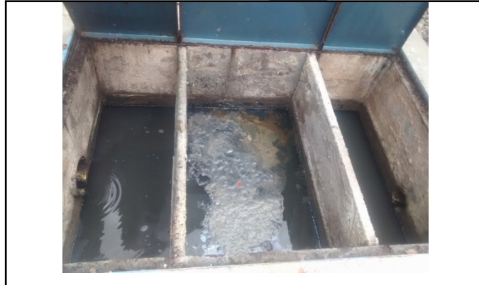
Foto No 2. Trampa de grasas