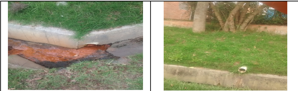
Foto No10 y 11. Tuberías de descargas de lluvias