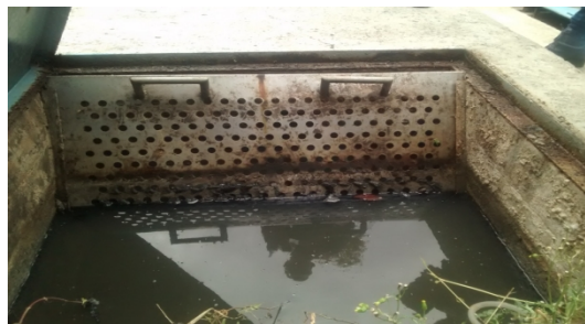
Foto No 4. Desarenador