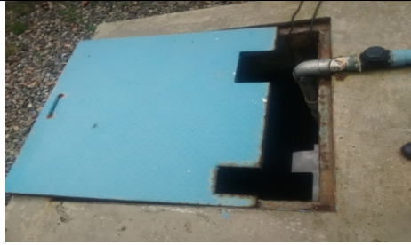
Foto No 5. Tanque homogenizador